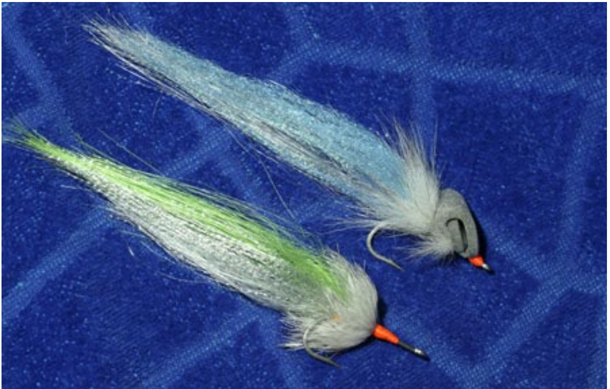
Två bra gäddflugor; en för de grunda vikarna och en för djupare vatten.