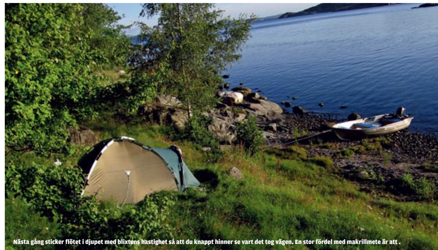
Nästa gång sticker flödet i djupet med blixstens hastighet så att du knappt hinner se vart det tog vägen. En stor fördel med makrillmete är att

En typisk dag består av både lugna och intensiva perioder, när man ena sekunden börjar fundera på om havet är helt dött, för att en stund senare ha hugg på flera spön samtidigt och det blir ett underbart kaos och full kalabalik i båten. En annan sak som många gånger förbryllar en är hur