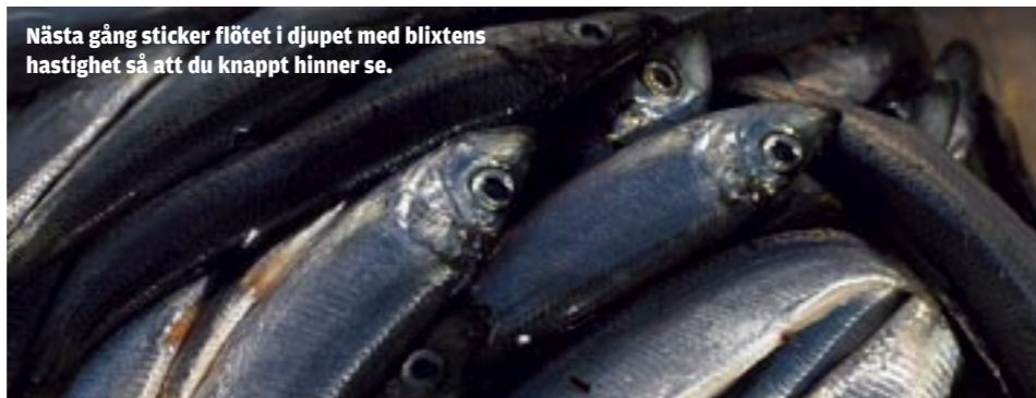
Nästa gång sticker flödet i djupet med blixstens hastighet så att du knappt hinner se.

Men som vanligt finns det mer eller mindre säkra ställen, och i regel är närhet till djupare, friskt vatten en bra utgångspunkt. Att hitta de platserna kan ibland vara löjligt enkelt, eftersom här ofta ligger en klunga